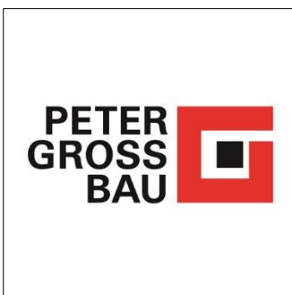
Peter Gross Bau

In unserem neuen Serienformat nehmen wir gängige Bau-Mythen unter die Lupe. Zum Start machen wir den Faktencheck zu einer Frage, die aktuell heiß diskutiert wird.